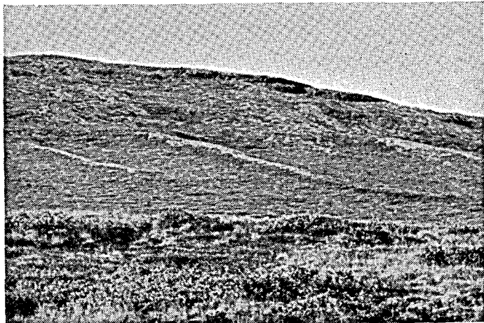
Fig. 2. «Slukásar» opstaaet i tværspalter, hvor smeltevandet er løbet ind under gletscheren. Sdr. Strømfjord.

2 km. Arsalik-aasen (fig. 3) ligger, hvor en lang og forholdsvis snæver dal munder ud paa en stor slette. Den har hovedsagelig samme retning som dalen, men følger dog en slingrende kurs ud over sletten. Den er opbygget af en halv snes rygge efter hinanden paa en lang række, adskilt af mindre mellemrum, der dog sjældent afbryder aasen helt. Langs siden ligger lave, men typiske aasgrave, der dog for en del erstattes af større søer. Aasens højeste partier ligger i proximaldelen, medens den distale del er lavere og smallere. Ogsaa paa flyvefotografier fremtræder aasen smukt, navnlig