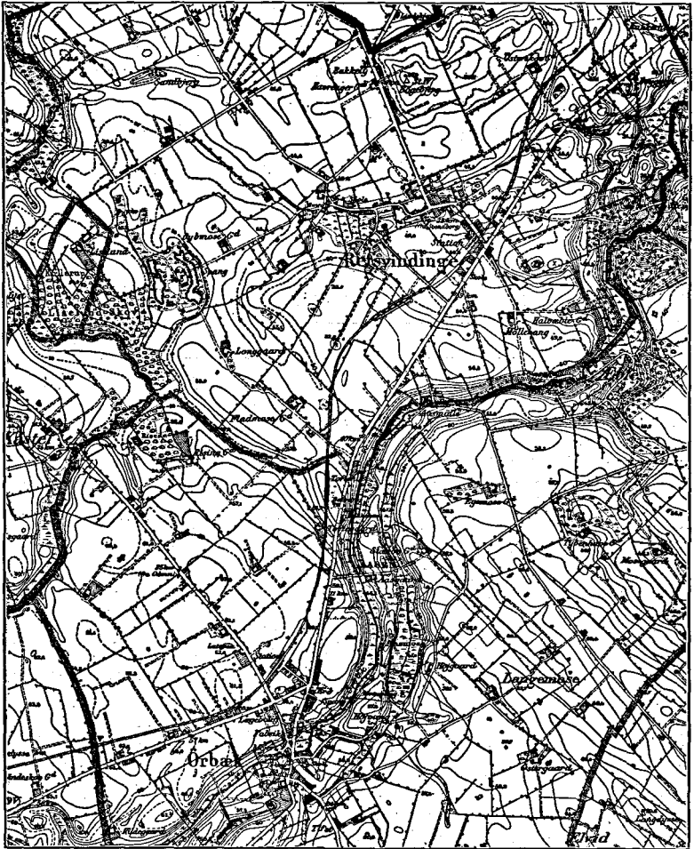
Fig. 3. Kort, der viser de sen-glaciale Dales Forløb i Egnen ved Refsvindinge samt Erosionsskrænt ved Bøgebjerg Nord for Refsvindinge. Efter Generalstabens Maalebordsblade 3717, 3718, 3817 og 3818. Maalestok 1:40000.

ningens nederste 2 km, hvor Gennemsnitsgradienten altsaa er 1:200, medens Faldet paa de øvrige 4,5 km kun er 16 m, d. v. s. 1:280. — Paa et eller andet Tidspunkt under denne svagt skraanende Dalflades Udformning har Erosionen dog været saa kraftig, at den har kunnet forme markerede Erosionsskrænter i Morænegrusbakkerne ved Paarup, 1 km