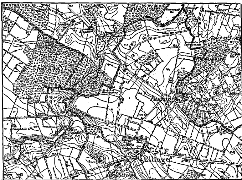
Fig. 2. Kort, visende sen-glacial Erosionsskrænt ved Paarup m. m. Efter Generalstabens Maalebordsblad 3717. Maalestok 1:4000 C.

Det førnævnte lille Vandløb Øst for Ellinge og parallelt med Villumstrup Aa er paa en Del af sit Løb ledsaget af en sen-glacial, tydelig Dalform. Paa nogle Steder findes der i Følge den geologiske Kortlægning et tyndt alluvialt Lag i den flade Dal, men Dalbunden bestaar iøvrigt af Lag af glacial Beskaffenhed. Dalen falder fra Refsvindinge til Holtsmølle, 1,6 km N. for Ellinge, fra 46 m til 20 m, d. v. s. 26 m paa 6,5 km, eller 1:250. Af dette Fald ligger der 10 m paa Stræk-