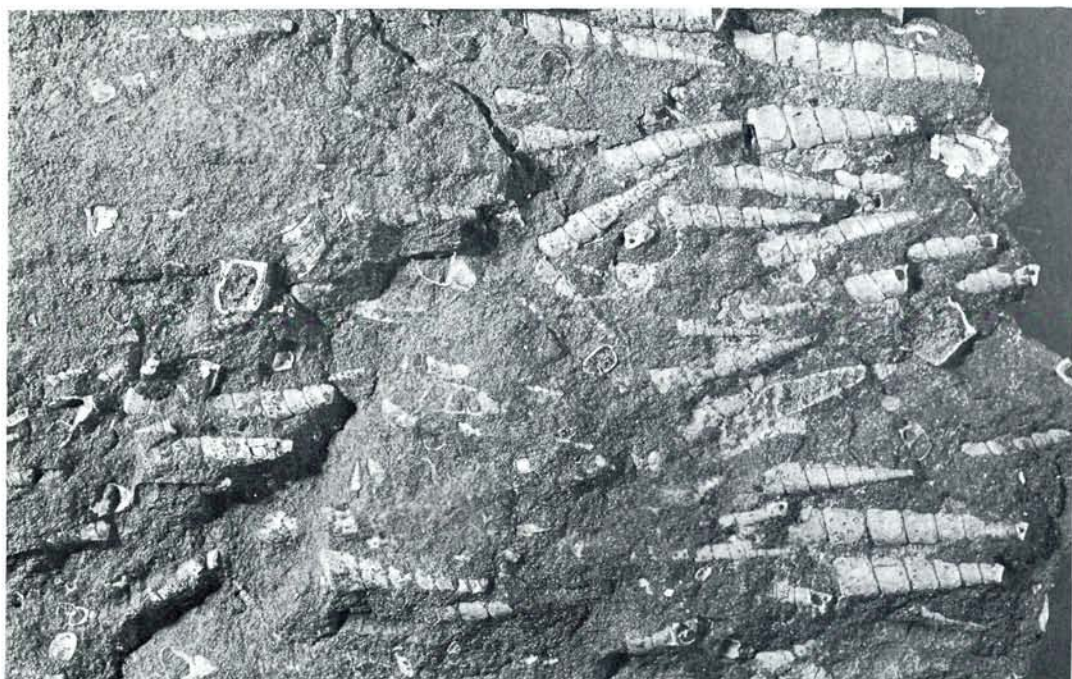
Fig. 1. Turritella-sandsten med strømorienterede snegleskaller. Bogø. Naturlig størrelse.