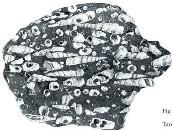
Fig. 2. Turritella-sandsten. Als. Naturlig størrelse.